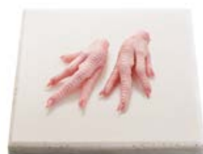
Pé sem canela Paw Pie de pollo (corte corto) 凤爪 Hühnerfuß ohne lauf جاجدل ادق 鶏足モミジ