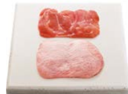
Coxa desossada Boneless leg Muslo sin hueso 无骨鸡腿肉 Unterkeule ohne knochen مظع نودب ذخف 骨なしレッグ