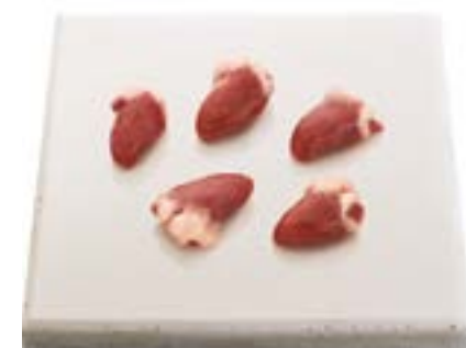
Coração Chicken heart Corazón 鸡心 Herz قجاجدل بلق ハツ