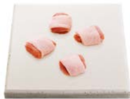
Coxa e sobrecoxa desossada com pele cortada Chicken leg (Kakugiri) boneless skin-on Patamuslo sin hueso y con piel en pedazos 去骨带皮鸡腿肉(Kakugiri 日式角切肉块) Unter- und oberkeule ohne knochen, mit haut und in stücke geschnitten دلجلاب مظع نودب يريجوكاك جاجدل ذخف チキンレッグ (角切り) 骨なし皮付き