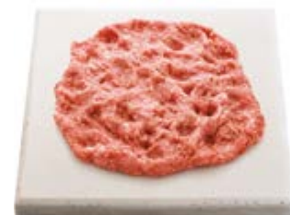
Carne mecanicamente separada (CMS) Mechanically deboned eat (MDM) Carne separada mecanicamente (CSM) 机械剔骨肉 Separatorenfleisch ايكيناكيم مظعل اعوزنم محل 機械式骨抜き肉