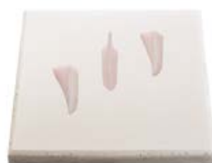
Cartilagem de peito Chicken breast cartilage (Yagen) Cartílago de pechuga 鸡胸软骨(Yagen) Hühner-brustknorpel (Yagen) نجاجي جاجدل ردص فورضغ 鶏胸肉軟骨 (やげん)