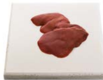
Fígado Liver Hígado 鸡肝 Leber دبك レバー