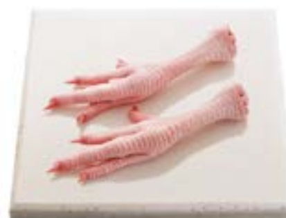
Pé Foot Pie de pollo 鸡脚 Hühnerfuß لجرأ 鶏の足