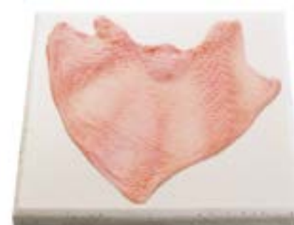
Pele Skin Piel 鸡皮 Haut دلج 鶏皮